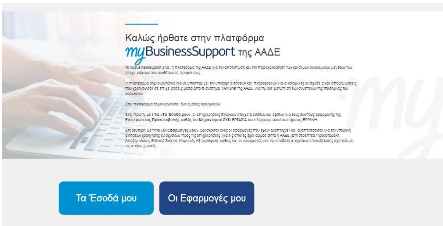
Εικόνα 1: Σελίδα της εφαρμογής στον διαδικτυακό τόπο της ΑΑΔΕ

Η σελίδα της εφαρμογής στο διαδικτυακό τόπο της Α.Α.Δ.Ε. είναι η παρακάτω. Για την είσοδο ο ενδιαφερόμενος επιλέγει «Οι εφαρμογές μου» και στη συνέχεια «ΑΞΙΟΓΡΑΦΑ»